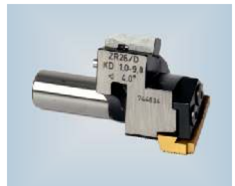
Der Strehlerhalter des ZR 26-I mit Halterkennzeichnung