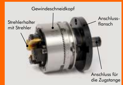
Die Hauptbauteile des WAGNER ® -ZR 26-I