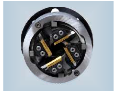
Der WAGNER - Gewindeschneidkopf ZR 26-I.