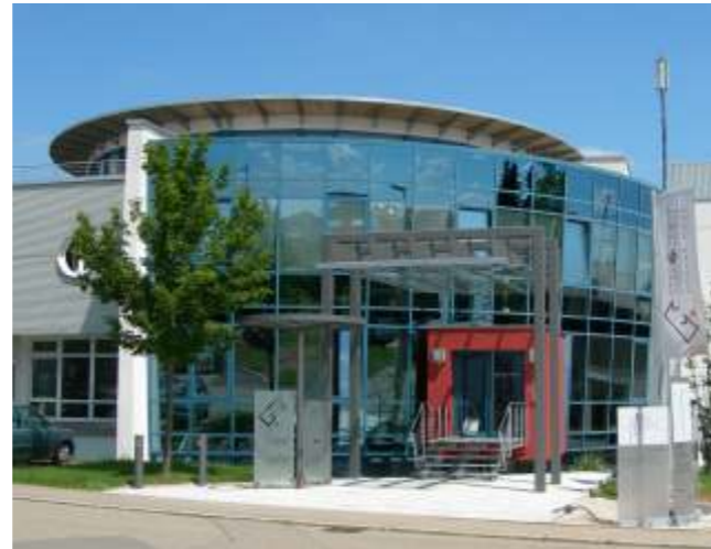
WAGNER® Sitz in Pliezhausen

Seit 1994 ist das WAGNER®- Gewindeprogramm unter dem Dach der Müller GmbH in Pliezhausen angesiedelt. Nun kann der Kunde aus dem gesamten Gewindewerkzeugprogramm das für ihn sinnvollste Verfahren auswählen: schneiden oder rollen .